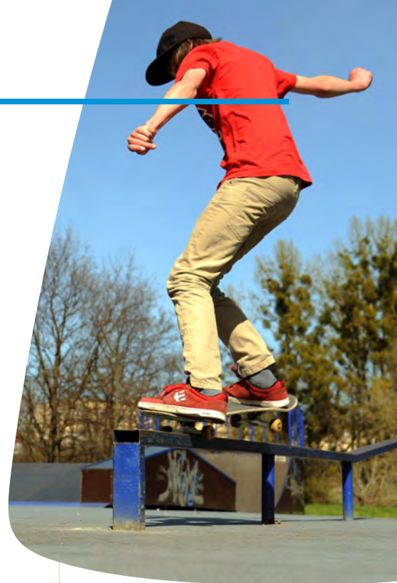
Skate Park na skwerze przy ul. Unii Lubelskiej

W ramach poszczególnych etapów doprowadzono do renowacji budynku przy ul. Mennica 6, adaptując go na potrzeby Centrum Pracy i Przedsiębiorczości. Wybudowano urokliwe kładki wiodące na wyspę oraz stworzono Międzywodzie. Kolejne prace przeprowadzone na Wyspie Młyńskiej polegały na rewitalizacji budynków Muzeum Okręgowego im. Leona Wyczółkowskiego z terenami je otaczającymi, w tym Białego Spichrza, w którym ulokowano wystawy archeologiczne. W budynku przy ul. Mennica 4 zorganizowano Europejskie Centrum Pieniądza, a Dom Młynarza przeznaczono na centrum informacyjno-recepcyjne. Gruntownej przebudowie uległ Czerwony Spichrz, w którym powstała Galeria Sztuki Nowoczesnej. Budynek przy ul. Mennica 7 przeznaczono na Dom Leona Wyczółkowskiego. W ramach kolejnej części projektu zagospodarowano tereny zielone, wybudowano amfiteatr, stworzono ścieżki rowerowe, plac zabaw oraz ciągi piesze, umocniono również nabrzeża oraz oświetlono wcześniej wyremontowane budynki i Międzywodzie. Ostatnia część prac była związana z zabudowaniami sportowymi, w ramach której wybudowano, między innymi, przystań jachtową wraz z niezbędną infrastrukturą przy ul. Tamka.