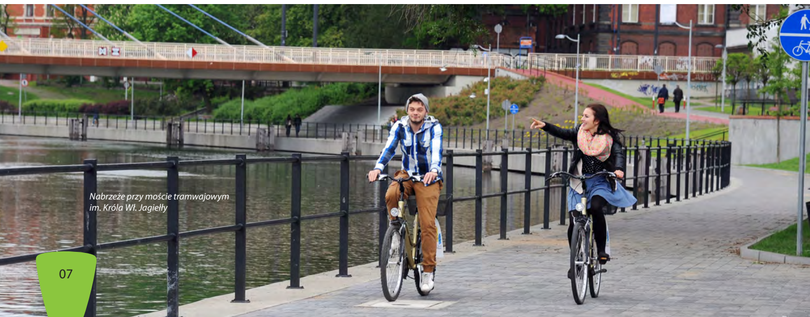
Nabrzeże przy moście tramwajowym im. Króla Wł. Jagiełły